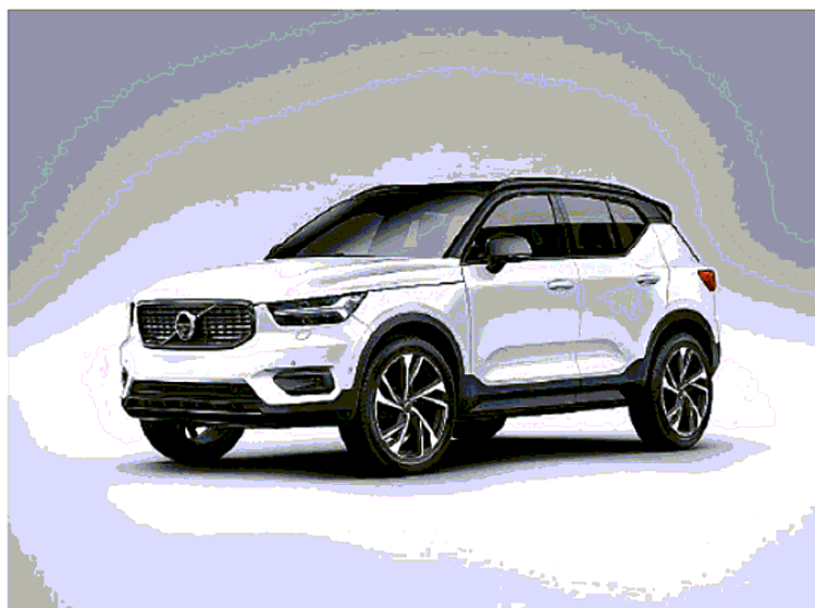
VOLVO La nuova XC40, proposta anche con la formula abbonamento

Dato il peso nell'economia italiana e l'apporto allo sviluppo, l'interessante convegno ha messo in evidenza che