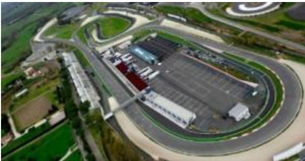
L'Autodromo di Vallelunga

Il nolegg io a lungo termine per privati è la vera scommessa di questi anni per noleggiatori e concessionari. Ma questo tipo di formula è già una realtà consolidata per le grandi aziende così come per le pmi e i liberi professionisti, che rappresentano il target privilegiato dei dealer. Ai gestori dei parchi auto di queste realtà è dedicato l'evento Fleet Motor Day , organizzato all'Autodromo di Vallelunga da Fleet Magazine, magazine del nolegg io a lungo termine e delle flotte aziendali. Obiettivo: far testare ai Fleet Manager i modelli più interessanti presenti sul mercato sui circuiti del noto autodromo.