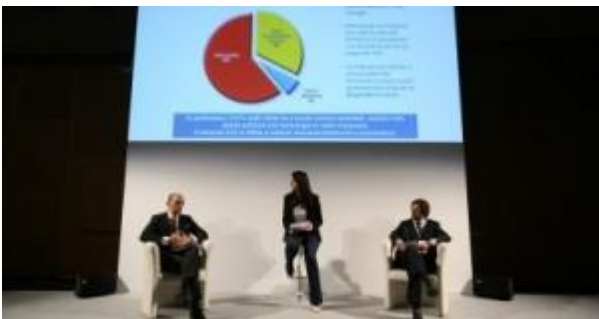
Un momento della plenaria del Fleet Motor Day

Quasi 450 partecipanti , tra i quali oltre 215 Fleet e Mobility Manager . Sono i numeri del Fleet Motor Day 2016 , seconda edizione dell'evento organizzato da Fleet Magazine andato in scena mercoledì all'autodromo di Vallelunga. Numeri che testimoniano il dinamismo di un settore, quello della mobilità aziendale, in continua evoluzione.