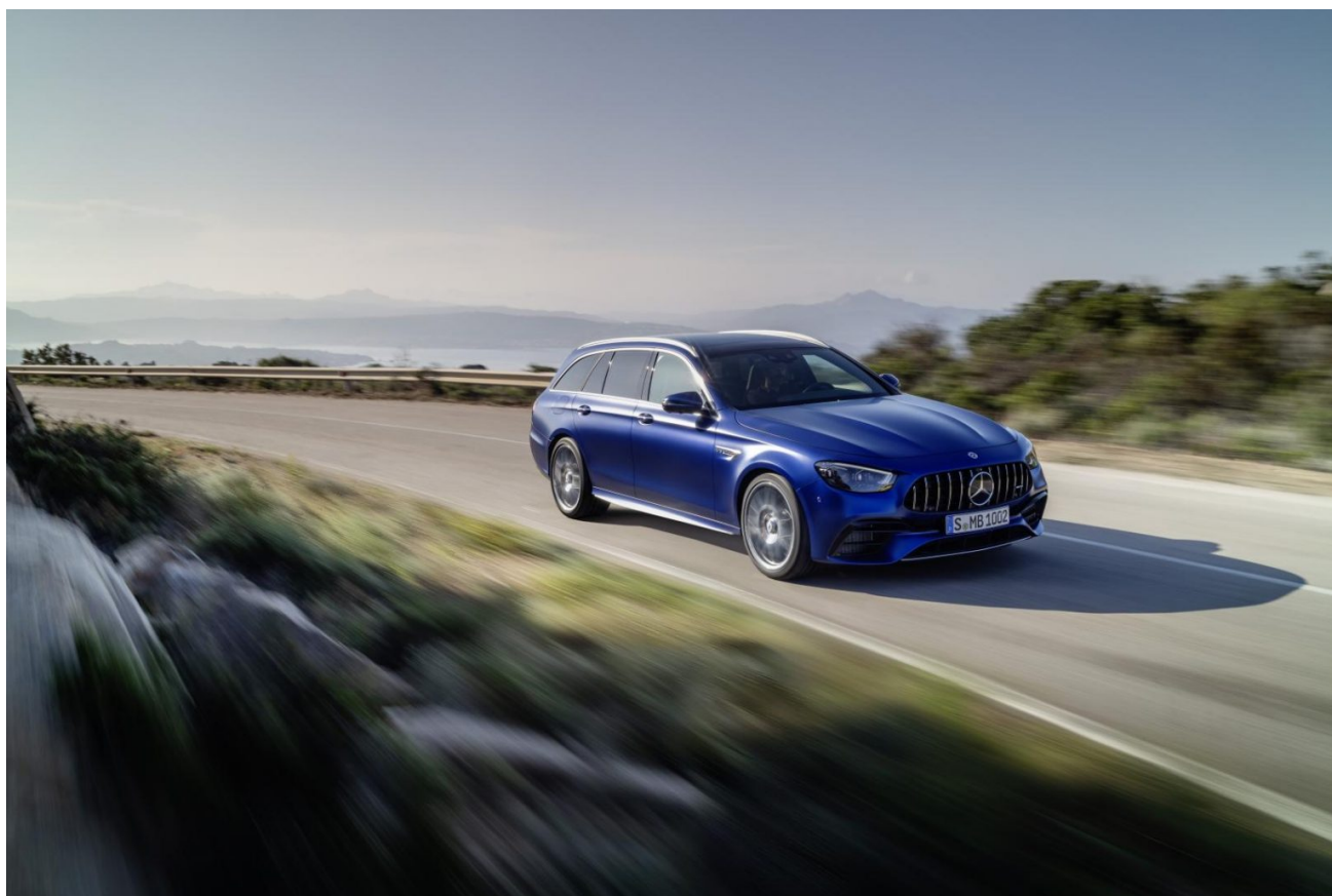
Mercedes E63S AMG

La pandemia ha stravolto gli scenari di mobilità, impattando fortemente anche sulle attività di noleggio veicoli. Malgrado questo, i cambiamenti in atto non hanno però arrestato il trend che vede sempre più automobilisti scegliere forme di mobilità pay-per-use rinunciando all'acquisto dell'auto: oggi sono oltre 65.000 i privati (senza partita IVA) che si affidano al noleggio a lungo termine