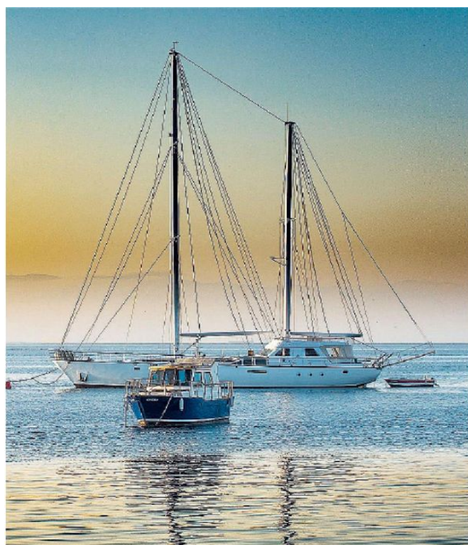
Il lusso di noleggiare. Per godere una vacanza da sogno