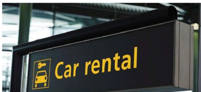
Anche i noleggi daranno un contributo alla ripresa