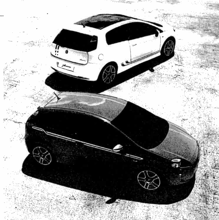
■ La Fiat Grande Punto è al primo posto nella classifica delle auto a noleggio a lungo termine. In questo settore, la richiesta dei furgoni e dei minibus guidabili con patente "B" è cresciuta del 10% in un anno.

cato nei primi dieci mesi del 2008. Un dato che, una volta superata la crisi economica in corso, lascia intravedere ampie possibilità di sviluppo per questo segmento del mercato automobilistico che, in altri Paesi dell'Europa Occidentale, raggiunge quote superiori a quelle conseguite