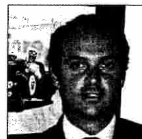
Alessandro Medi Drive Service

N. 48 - Anno VI - Aprile 2009 - Poste Italiane SpA - Spedizione in Abbonamento Postale - DL 353/2003 (conv. in L. 27/02/2004 n. 46 art. 1 comma 1 DCE) Milano - Euro 9,50