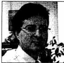
Roberto Cavaliere Movers Rent