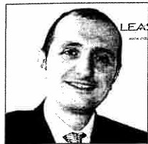
Fabrizio Ruggiero Leasys