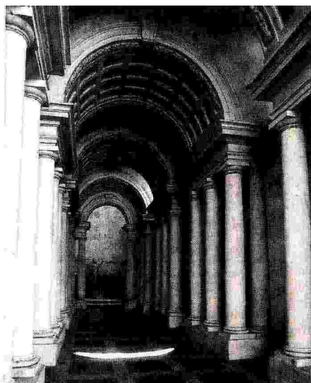
Palazzo Spada, sede del Consiglio di Stato