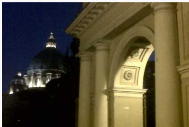
Roma – Musei Vaticani

Sono questi gli obiettivi di “ Missione Mobilità ”, la manifestazione in programma a Roma il 21 e 22 giugno presso la sede della Pontificia Università Lateranense (piazza San Giovanni in Laterano, 4), promossa da AMOER – Associazione per una Mobilità Equa e Responsabile e presentata oggi presso la sede dell’ACI.